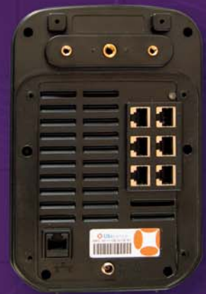
Vue arrière d'un TT Sensor.

Par conséquent, TiMax Tracker offre, pour un budget modique, un système d'entrée de gamme, susceptible d'évoluer par la suite vers un haut degré de redondance et de fiabilité, pour gérer des environnements plus complexes ou plus difficiles. En ce qui concerne l'environnement d'utilisation, les TT Sensors sont classés IP30 d'origine ; des versions entièrement tropicalisées sont disponibles.