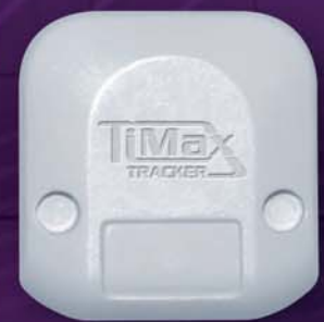
Tag en taille réelle

Cette fonction de communication sur 2,4 GHz, en bidirectionnel permet au système de renseigner et de gérer les Tags de façon dynamique : modification de la fréquence de rafraîchissement, suivi de l'état des piles... Côté étanchéité, les TT Tags sont classés IP63 d'origine.