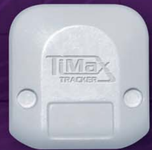
Tag en taille réelle

Cette fonction de communication sur 2,4 GHz, en bidirectionnel permet au système de renseigner et de gérer les Tags de façon dynamique : modification de la fréquence de rafraîchissement, suivi de l'état des piles... Côté étanchéité, les TT Tags sont classés IP63 d'origine.